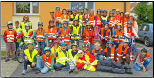
Radfahrprüfung – alle bestanden

? UNSER ZIEL für das Schuljahr 2006 / 2007: „BEWEGTES